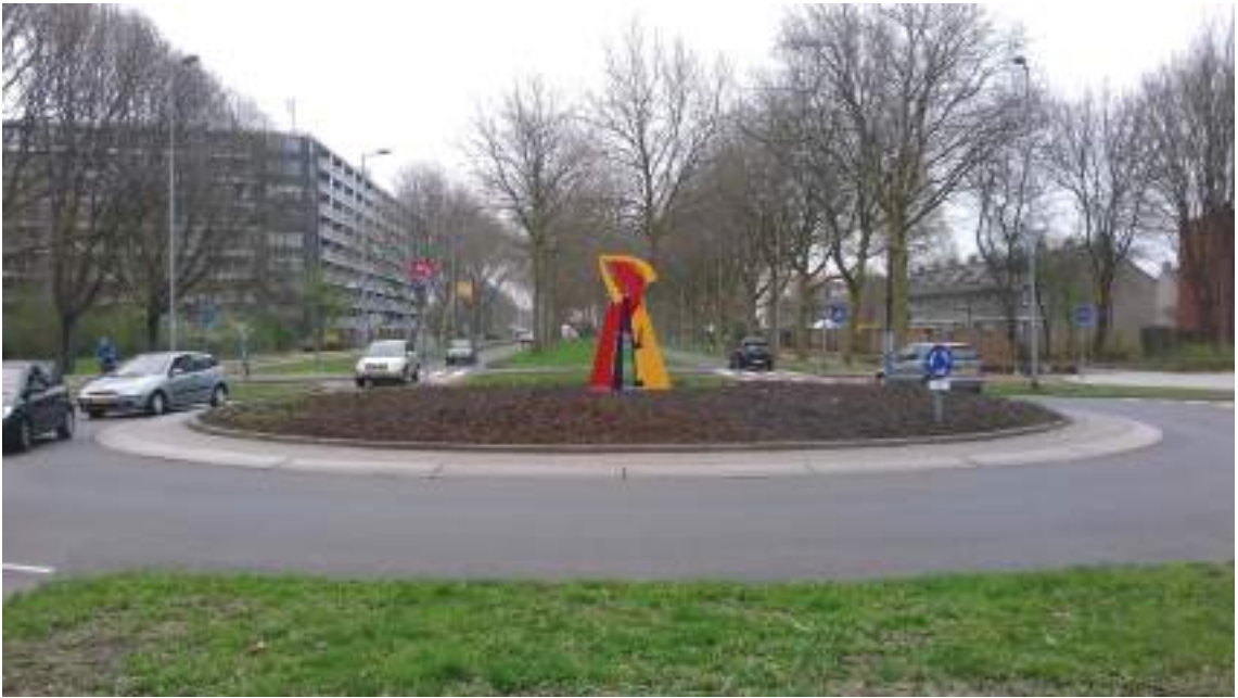
Pr Rooseveltweg – Björnsonweg Cymbelkruid

verkeersrotonde te plaatsen. Stichting De Witte Bollen (beheerder van Ommoordse kunstwerken in de buitenruimte) pakte dat op en combineerde het project met nog twee andere kunstwerken, zodat er nu drie in Ommoord staan.