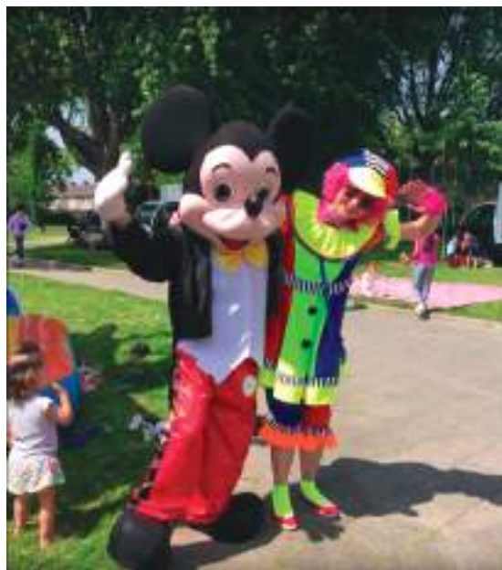
Clown Iriska van Iriska Party

Amelie Petersen is het vriendinnetje en woont in de grasbuurt. Ook zij vind het super leuk. Het