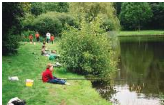
Vissen voor je diploma