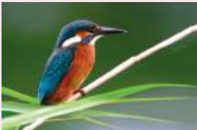
Gezien in Ommoord

Wie goed om zich heen kijkt kan in Ommoord de mooiste vogels waarnemen. Dit keer was het een ijsvogel die zat op een