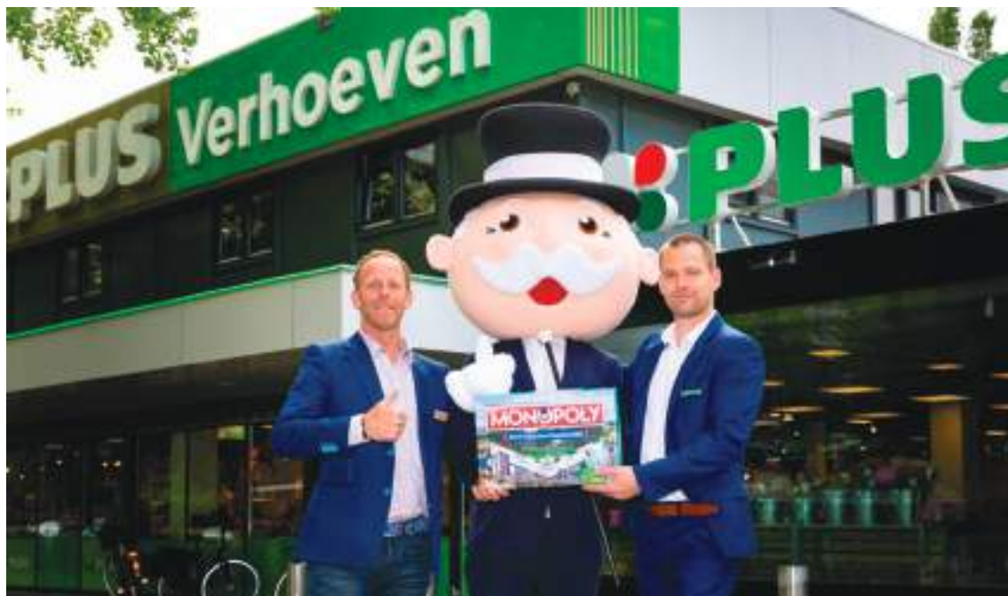
Plus Verhoeven, Binnenhof Rotterdam-Ommoord

Monopoly, wie kent dit spel niet of heeft het wel eens gespeeld. Er zijn diverse speciale uitgaven van in omloop. Nu komt er ook een eigen Ommoordse versie.