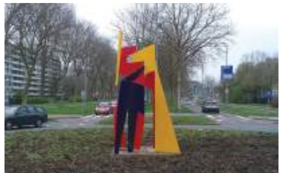
Pr Rooseveltweg – Marshallweg Blauwgras