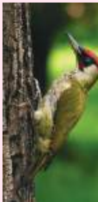
Gezien in Ommoord de Groene specht

Onverwachte ontmoeting: een groene specht, tijdens het wachten op de autowas bij de Shell/Terbregseveld. De groene specht is een relatief grote