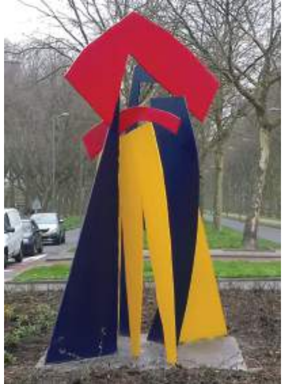
Pr Rooseveltweg – K. Onneswegweg Boterbloem

Deze Ommoordse bewoners waren het meer dan zat dat de werken niet meer werden onderhouden. Een van hen, Ruud Eering, kwam met het idee het kunstwerk op de vlakbij gelegen